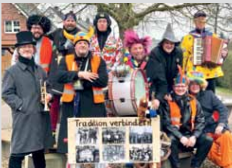
Faslam in Diepenau am ersten Februarwochenende Seite 3

Terminübersicht 2023 der Lavelstloher u. Diepenauer Vereine im Innenteil