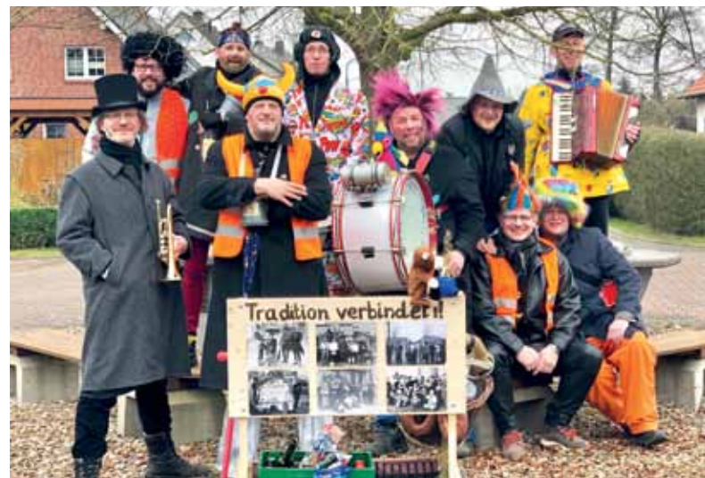
... und 100 Jahre später

Wie in vielen anderen Vereinen auch, hat die Zahl der Aktiven beim Faslam über die Jahre immer weiter abgenommen. Über „Nachwuchs“ würde sich der Faslamverein sehr freuen.