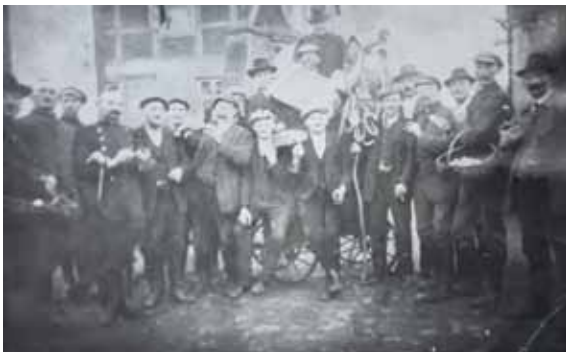
Faslam in den 1920er Jahren ...

Seit mehr als 300 Jahren, wahrscheinlich sogar noch länger, werden in Diepenau die Wintergeister vertrieben. Viele Geschichten und Anekdoten, die immer wieder gern erzählt, aber kaum aufgeschrieben wurden, sind beim Faslam entstanden. In vergangenen Zeiten war es das Hauptfest des Ortes, es wurde bei wechselnden Gastgebern auf der Diele gefeiert. Später teilten sich die ortsansässigen Gastwirtschaften Bramkamp, Mußmann, Möhring und Peper reihum die Ausrichtung des Festes.