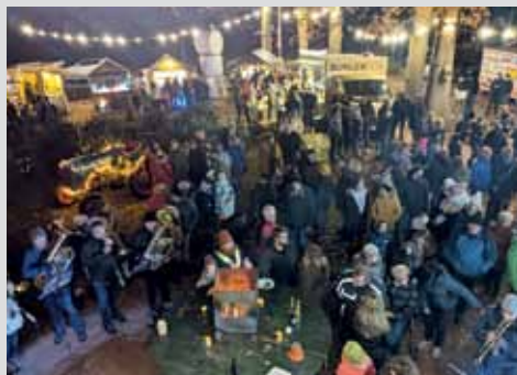
Der HOF 1787 sagt DANKE! Seite 6