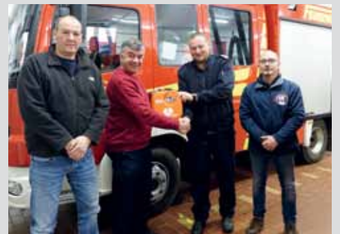
Feuerwehr Diepenau erhält Defibrillator Seite 14