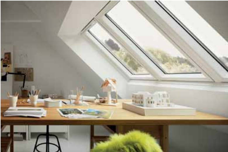
Das Dachgeschoss bietet mit viel Tageslicht optimale Voraussetzungen für ein Arbeitszimmer und schafft eine räumliche Trennung zwischen Arbeit und Privatleben

Erst Corona, jetzt Energiekrise: Wenn Arbeitgeber aufgrund hoher Infektionszahlen oder notwendiger Energieeinsparungen Mitarbeiter über längere Zeit ins Homeoffice schicken, kann „Working from Home“ auch zur Belastungsprobe werden. Um dem vorzubeugen, ist es wichtig, feste Rückzugsorte zum Arbeiten, aber auch zum Entspannen zu schaffen.